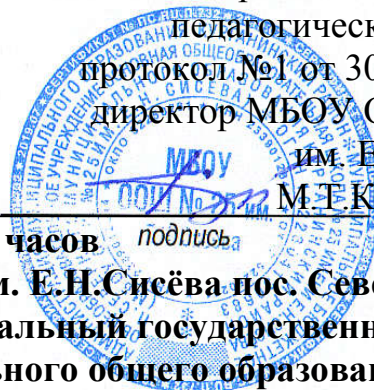
Таблица-сетка часов учебного плана МБОУ ООШ № 25 им. Е.Н.Сисёва пос. Северный для 3- класса, реализующих федеральный государственный образовательный стандарт начального общего образования на 2022 – 2023 учебный год