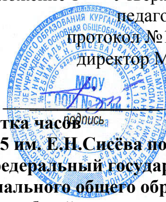
Таблица-сетка часов учебного плана МБОУ ООШ № 25 им. Е.Н.Сисёва пос. Северный для 2 - класса, реализующего федеральный государственный образовательный стандарт начального общего образования на 2022 – 2023 учебный год

Приложение 1 Утверждено решением педагогического совета протокол №1 от 30.08.2022 г. директор МБОУ ООШ № 25 им. Е.Н. Сисёва М.Т.Корнилович